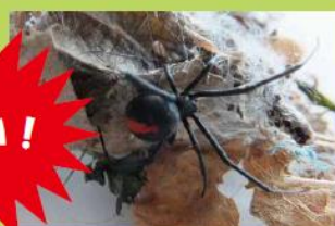
巣の張り方は不規則で立体的です。